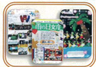
パネルで活動紹介