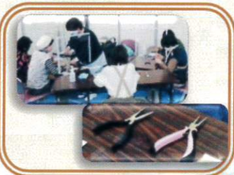
手作り体験ワークショップ