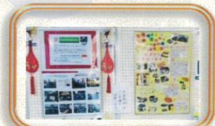
パネルで活動紹介

「まつばら ボランティア 市民活 動フェスタ～集まれば大き な力!!はじめの一步～」は、多 くの方にご来場いただき、会場 は楽しく和やかな雰囲気にな りました。お越しいただいたみ なさま、参加者のみなさま、ボ ランティアのみなさま、あり がとうございました！